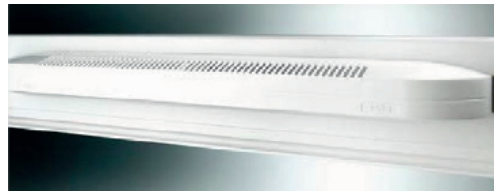
Grille de ventilation acoustique