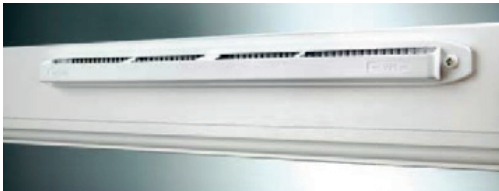
Grille de ventilation standart