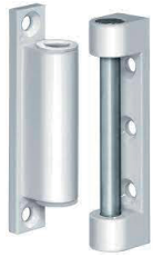
Fiche compas à vis caché