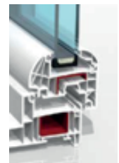
Renfort en acier galvanisé