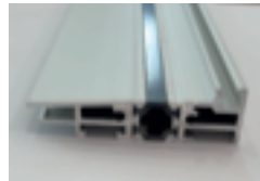
Seuil aluminium à rupture de pont thermique